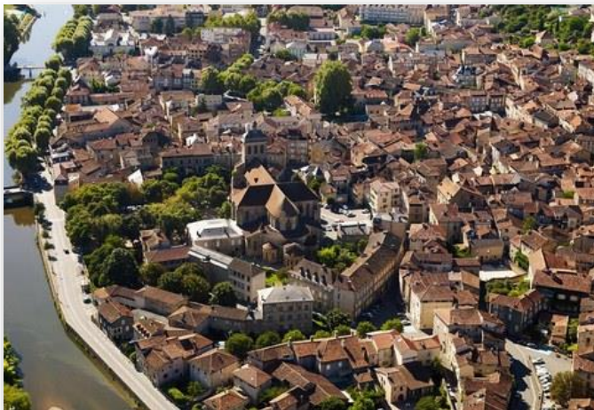
Plaine de Londieu

FIGEAC CAPDENAC QUERCY FC vous accueille à Figeac, ville du Lot située à l'extrémité Nord du département, établie dans la vallée du Lot .