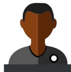
MPOSA-GONDA Edgar Éducateur Lycée