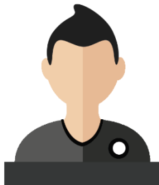
PLEIMPONT Sébastien Éducateur Collège